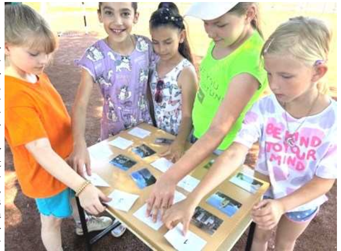
Mert „istvánosnak” lenni jó!

minden ellenőrzőpontra. A legeredményesebb csapatokat különleges meglepetés várta, mozijegy volt találatkonyságuk, gyorsaságuk és kitűnő csapatmunkájuk jutalma. Az akadályverseny izgalmaiban kimerült gyermekek visszavonultak tantermükbe, ahol hűsítő jégkrém és ízletes hamburger várta őket. Iskolánk aprajagya remekül szórakozott ezen a különleges napon, bízunk benne, hogy minden tanulóknak felejthetetlen élményekkel gazdagodott.